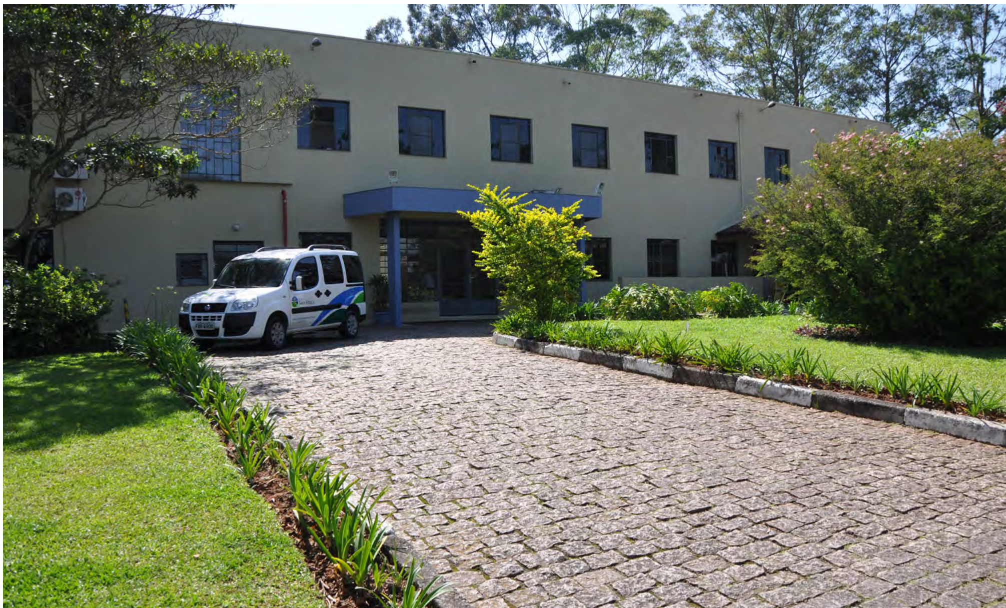
ESTRUTURA ATUAL DO HOSPITAL SANTA MÔNICA