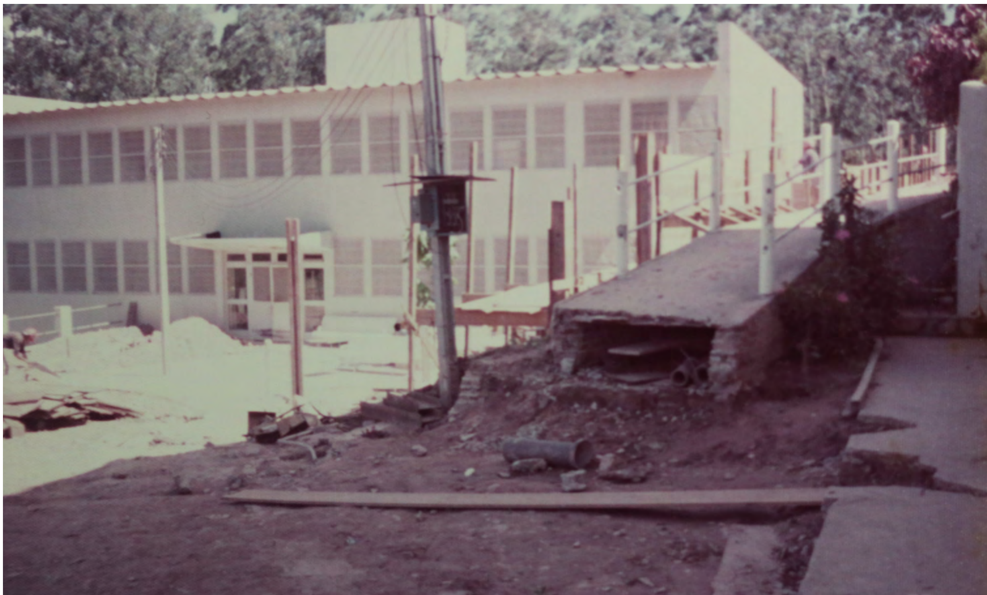
FUNDAÇÃO DO HOSPITAL SANTA MÔNICA